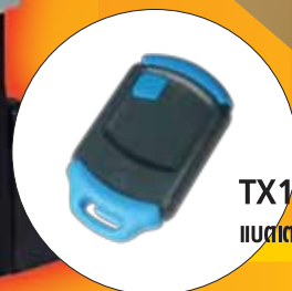
TX1NV แบตเตอรี่ 12V, 23A