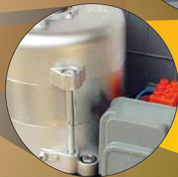
PY AC Motor Controller